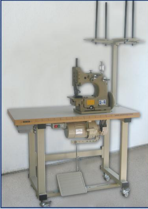
GS 2500, GS 2500H GS 2500-2, GS 2500-2H